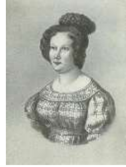
Екатерина Ивановна Трубецкая

Дата рождения: 27 ноября 1800 Дата смерти: 14 октября 1854 (53 года) Место смерти: Иркутск